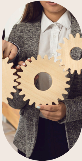
Plan de développement des compétences