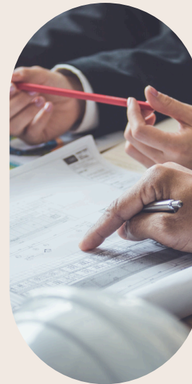
Déploiement des formations